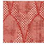
L4519_ZELDA_ N3103_FE_VER SO