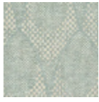
L4519_ZELDA_ C537_FE_VERS O