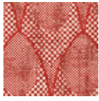
L4519_ZELDA_ N3103_FE_VER SO