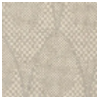
L4519_ZELDA_ B20_FE_VERS O