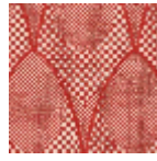
L4519_ZELDA_ N3103_FE_VER SO