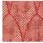
L4519_ZELDA_ N3103_FE_VERS O