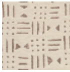
L4520_BAMAK O_B94_B70_F E