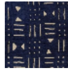
L4520_BAMAK O_C531_FG_V ERSO