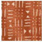
L4520_BAMAK O_B41_B58_FE _VERSO