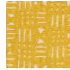
L4520_BAMAK O_N3010_FE_V ERSO