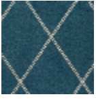
L4530_GRAND S_CROISILLON S_B65_FE