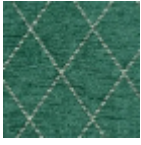
L4530_GRAND S_CROISILLON S_C538_FE