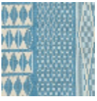
L4532_TOMBO UCTOU_B37_B 39_FE