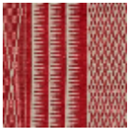
L4532_TOMBO UCTOU_C519_ FM