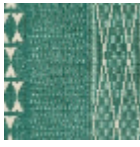
L4532_TOMBO UCTOU_C538_ FE