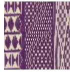
L4532_TOMBO UCTOU_N3020 _FE