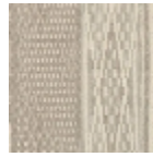
L4532_TOMBO UCTOU_N3003 _FE