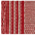
L4532_TOMBO UCTOU_C519_ FM