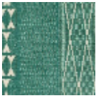
L4532_TOMBO UCTOU_C538_ FE