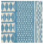
L4532_TOMBO UCTOU_B37_B 39_FE