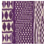
L4532_TOMBO UCTOU_N3020 _FE