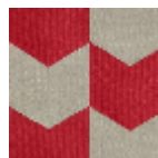
L4534_LES_FL ECHES_N3014_F FM