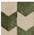
L4534_LES_FL ECHES_C541_F G