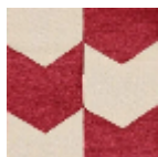
L4534_LES_FL ECHES_C523_F E