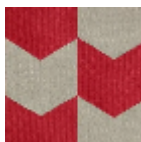
L4534_LES_FL ECHES_N3014_F FM