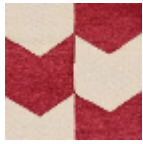
L4534_LES_FL ECHES_C523_F E