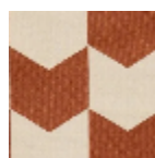
L4534_LES_FL ECHES_N3013_F FE