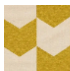
L4534_LES_FL ECHES_B76_F E