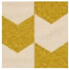
L4534_LES_FL ECHES_B76_F E