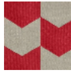
L4534_LES_FL ECHES_N3014_F FM