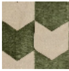
L4534_LES_FL ECHES_C541_F G