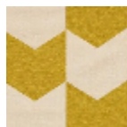
L4534_LES_FL ECHES_B76_F E