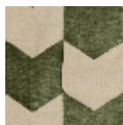
L4534_LES_FL ECHES_C541_F G