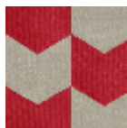
L4534_LES_FL ECHES_N3014_F FM