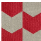
L4534_LES_FL ECHES_N3014_ FM