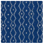
L4535_ZANZIB AR_B53_FE_VE RSO