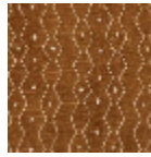
L4535_ZANZIB AR_C512_FE_V ERSO