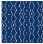
L4535_ZANZIB AR_B53_FE_VE RSO