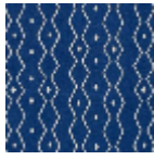
L4535_ZANZIB AR_B53_FE_VE RSO