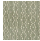
L4535_ZANZIB AR_N3134_FE_ VERSO