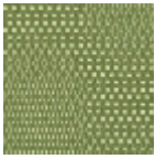
L4540_LOME_ B23_FE_VERS O