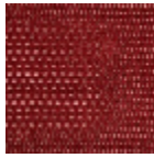
L4540_LOME_ C525_C526_FE _Verso