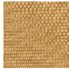
L4540_LOME_ N3143_FE_VER SO