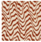
L4541_KENYA_ C517_FE_VERS O