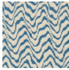
L4541_KENYA_ B21_B39_FE_V ERSO