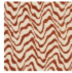
L4541_KENYA_ C517_FE_VERS O