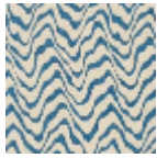
L4541_KENYA_ B21_B39_FE_V ERSO