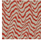
L4541_KENYA_ N3176_FM_VERS O