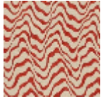
L4541_KENYA_ N3176_FG_VERS SO