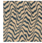
L4541_KENYA_ C534_FB_VERS SO