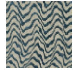
L4541_KENYA_ C534_FM_VERS SO