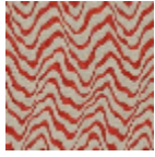
L4541_KENYA_ N3176_FM_VERS RSO