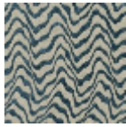
L4541_KENYA_ C534_FM_VERS SO