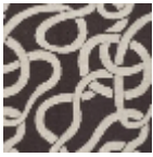
L4543_LES_RU BANS_B72_FE _Verso