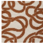
L4543_LES_RU BANS_N3013_F E