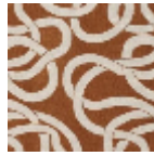
L4543_LES_RU BANS_N3013_F E_Verso