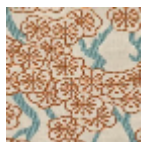
L4551_POMMI ERS_BICOLOR ES_N3013_N30 16_FE