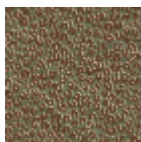
L4570005 Vert d'eau