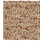
L4602_BOURB ON_N3021_N3 003