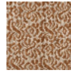
L4602_BOURB ON_N3021_N3 003_VERSO