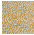
L4602_BOURB ON_C537_C515 _VERSO