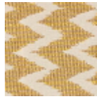
L5001_SULLY_ N3139_N3004_ FE