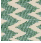
L5001_SULLY_ N3135_N3149_F E