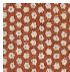
L5002_YAOUN DE_N3024_N3 013_FE