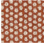
L5002_YAOUN DE_N3024_N3 013_FE