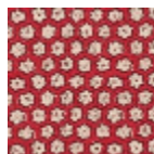
L5002_YAOUN DE_B13_B02_F E