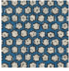
L5002_YAOUN DE_B54_B21_F E