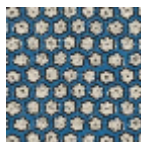
L5002_YAOUN DE_B54_B21_F E