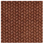
L5003_TRESSA GE_C509_C517 _FM