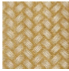
L5003_TRESSA GE_C515_N300 4_FE