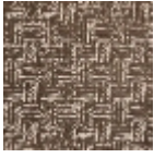
L5004_CONG O_C507_C512_ FM