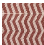
L5006_BOMA_ N3024_N3022_ FE