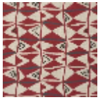
L5007_BENIN_ B84_B54_B65_ FE