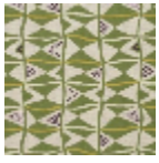
L5007_BENIN_ B23_B14_B76_ FE