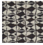
L5007_BENIN_ N3011_N3002_ N3159_FE