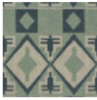
L5008_BURKI NA_B65_B31_F M