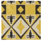
L5008_BURKI NA_B54_N3010 _FE