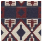
L5008_BURKI NA_B13_B38_F E