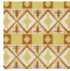
L5008_BURKI NA_N3013_N30 17_FE