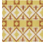
L5008_BURKI NA_N3013_N30 17_FE