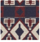
L5008_BURKI NA_B13_B38_F E