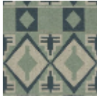
L5008_BURKI NA_B65_B31_F M