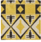
L5008_BURKI NA_B54_N3010 _FE