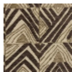
L5011_TACHAD _C510_C507_F G