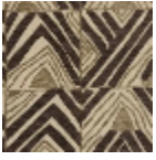
L5011_TACHAD _C510_C507_F G