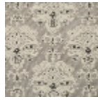
L5014_AUBIGN Y_N3003_B69_ FE