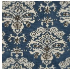
L5014_AUBIGN Y_C533_C534_ C510_C508_FE