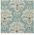
L5014_AUBIGN Y_B30_B73_B7 1_B69_FE