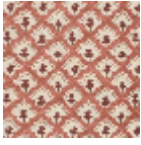
L5018_GOYA_ N3104_N3024_ FE