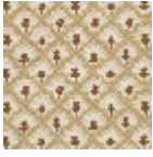
L5018_GOYA_ N3004_B28_F E