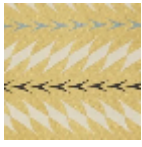
L5019_FIORI_N 3016_N3139_N3 002_FE