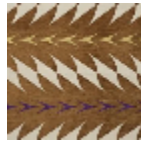
L5019_FIORI_N 3020_C512_N31 39_FE