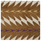
L5019_FIORI_N 3020_C512_N31 39_FE