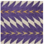
L5019_FIORI_B 32_C528_B58_ FE