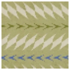
L5019_FIORI_C 532_C543_C53 9_FE