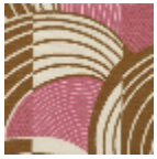
L5020_REBON DS_B28_B16_F E