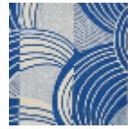
L5020_REBON DS_N3019_N31 26_FE