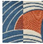
L5020_REBON DS_C533_N301 5_FE