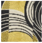
L5020_REBON DS_B54_N3010 _FE