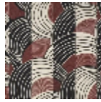
L5020_REBON DS_B54_N302 4_FE