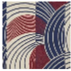
L5020_REBON DS_B38_N3025 _FE