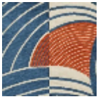
L5020_REBON DS_C533_N301 5_FE