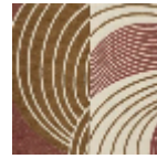
L5020_REBON DS_N3021_N30 24_FE