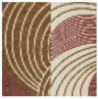
L5020_REBON DS_N3021_N30 24_FE