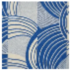
L5020_REBON DS_N3019_N31 26_FE