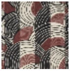
L5020_REBON DS_B54_N302 4_FE