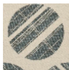
L5024_GRAND _TOKYO_N3137 _FE