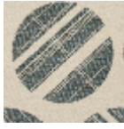
L5024_GRAND _TOKYO_N3137 _FE