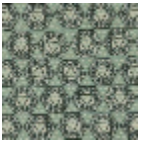
L5025_ISFAHA N_B73_B91_B6 5_B54_FA