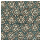
L5025_ISFAHA N_C535_N3158 _FE