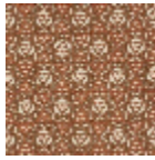
L5025_ISFAHA N_N3013_N302 1_FE