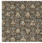
L5025_ISFAHA N_N3137_N315 9_FG