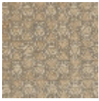
L5025_ISFAHA N_C504_B71_F G